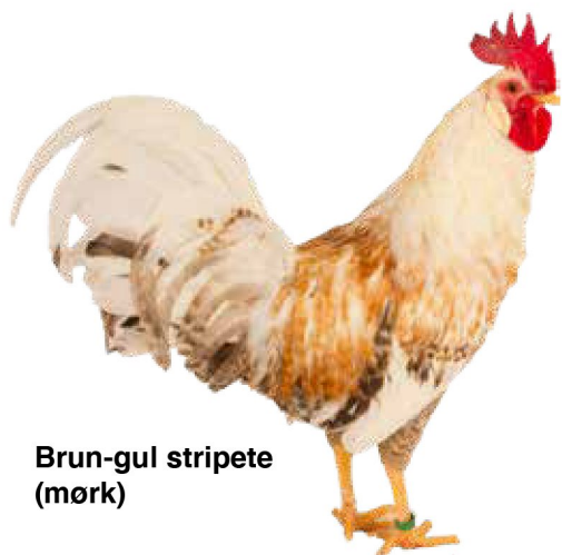
Brun-gul stripete (mørk)