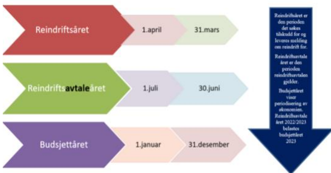
Figur 5. Oversikt over perioden for reindrifftsåret, reindrifftsavtaleåret og budsjett året.

Forvaltningen skal ha oversikt over hvilken budsjettperiode de ulike reindrifftsavtalene gjelder for. Reindrifftsåret viser hvilken periode som det skal leveres melding om reindrift for. Og reindrifftsavtaleåret er den perioden reindrifftsavtalen gjelder. Dette er forsøkt illustrert i figur 5 nedenfor.