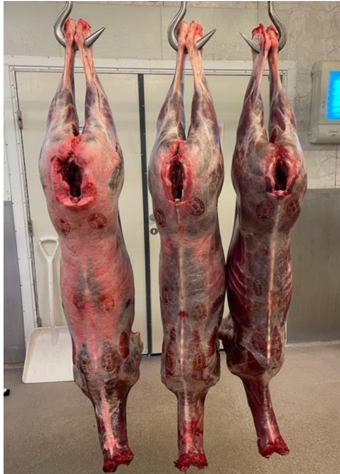
Bilde 1: Viser tre slakt der slaktet til venstre er klassifisert til klasse R, den i midten til klasse O+ og den lengst til høyre har fått klasse O.

prissetting. Under et klassifiseringssystem belønner man derfor skrotter med god kjøttfylde.