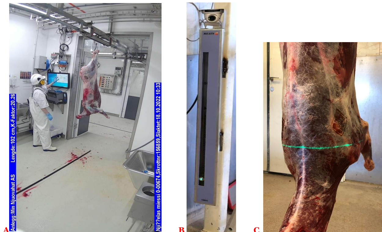
Bilde 2. A) Autogenerert bilde av klassifisering med lengdemåling, ved Min Boazu AS i Karasjok. B) Lengdemåler med kamera. C) Korrekt plassert laserlinje på nedre målepunkt på et reinsdyrslakt.

Slaktets lengde er avstanden fra øvre til nedre målepunkt. Øvre målepunkt er i underkant av der slaktekrok går under akilles. Nedre målepunkt er der nakke- og frampartmuskulatur møtes i et naturlig, nedsunken punkt som finnes på alle reinslakt. I klassifiseringsøyeblikket autogenereres et bilde som dokumenterer slaktet og laserlinjen fra lengdemålingen. Bildet lagres i en bildedatabase hos Animalia.