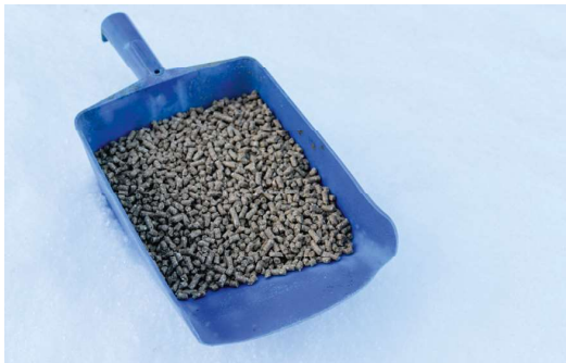
Fápmofuoðarat (govas) ja rásse-pelletsat sisttisdoallet sullii 90 proseantta goikeávnнас. Dainna lágiin fievrreda unnán čázi biebmabáikái. Govven: Svein Morten Eilertsen, NIBIO

Liigefuoðara goikeávnnessidoallu lea dehálaš go galggat válljet iešgudetlágan fuoðarsorttaid gaskkas. Goikeávnнас lea dat oassi fuoðaris mii ii leat čáhci ja mas bohccot galget suolbmudanoliin oažžut biepmu. Njuoska fuoðara, mas lea vuollegis goikeávnнас-proseanta, lea divrras fievrredit ja dat jiekŋu álkit.