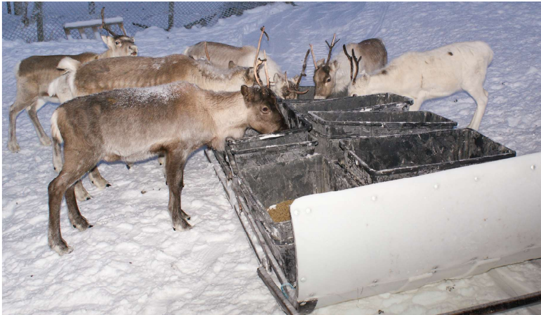
Reahka mainna fievrrida fuođđariid.