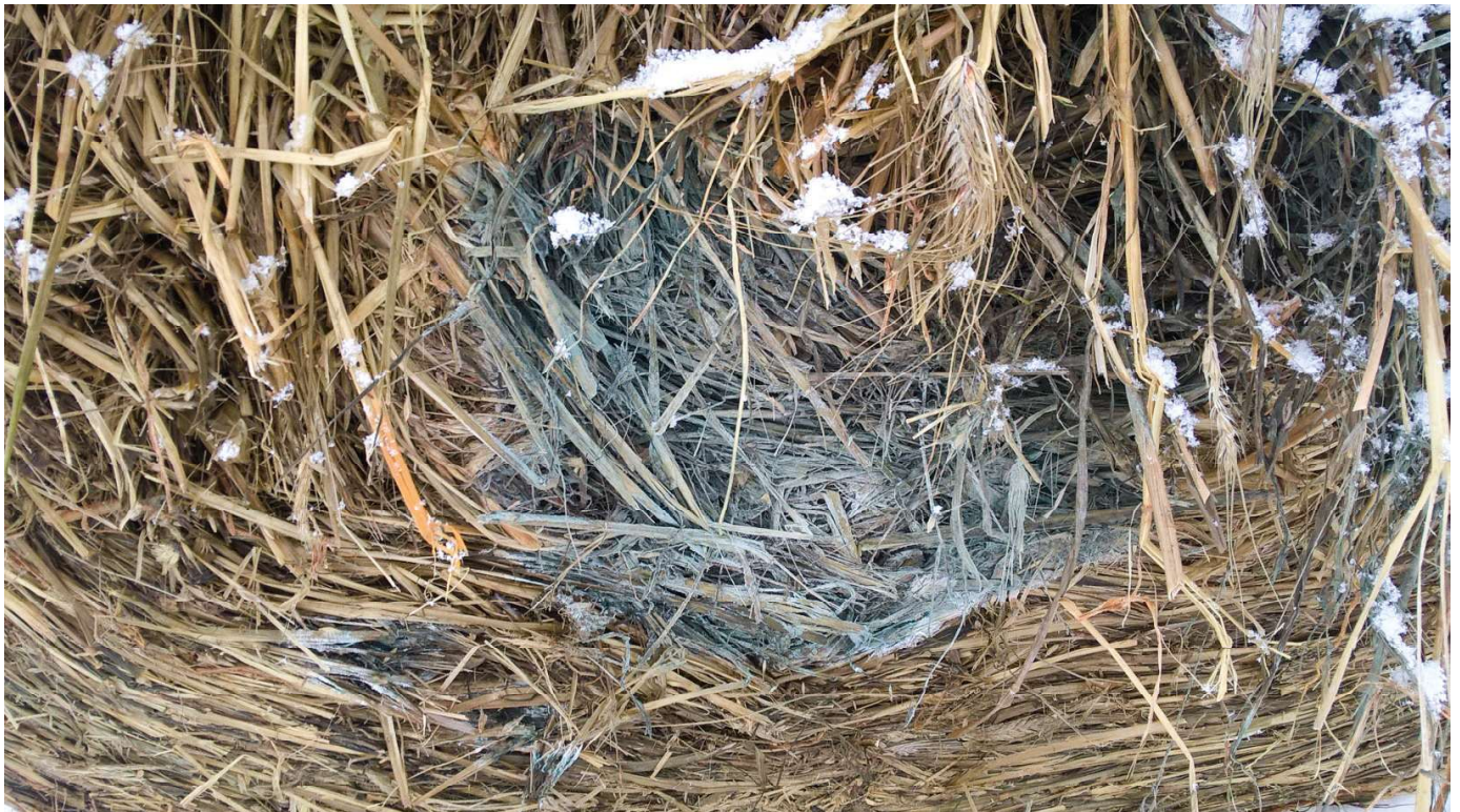
Il galgga biebmátt bohccuid suoidnespáppaiguin mat leat guhppon.