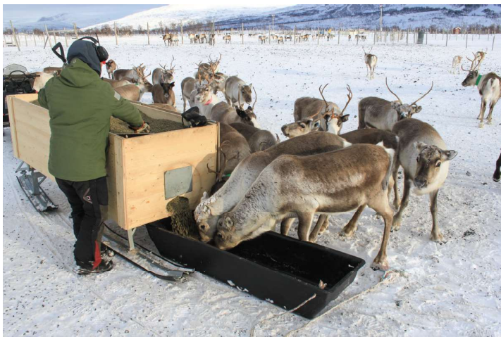
Olu boazodolliin leat iešgudetlágan vásáhusat biebmaniin. Muhto, buot boazodoallit geat bibmet seamma guovllus guhkit ággi – sihke muohtan ja bievlan – ávžuhit atnit fuodargári – maiddá obbasis ja go bibmet fápmofuođđariiguin dahje rásse-pelletsain.

guhkimusas eret biebmanajit. Ja go nu dahket, de eai guođo dábálaš guohtuneatnamiin ge, ja biebman dagaha eanet nealggi geahnohis bohccuide. Jus biepmat beare unnán, de lea várra ahte stuora, gievrras bohccot ožžot buoret vuoimmi, seammás go unnimus bohccot nelgot jámas. Muhtin boazodoallit addet lagabui guokte kilo fápmofuođđara beaivválaččat juohke bohcco nammii ealus, sihkkarastin dihte ahte buot bohccot ožžot borrat. Earát ges oaivildit ahte 0,75 kg beaivái lea doarvái jus kombinere suinniiguin/suoidnespáppain, dahje jus guhtot vel dasa lassin.