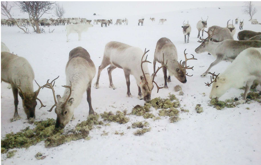
Go lonuha fuođđara, dahje go guohtumis sirdá fuođđariidda, de dárbbáša boazu áiggi hárrjánit máhkui. Jus dus leat jeahkálát olámutus, de sáhtát seaguhit liigefuođđara jeahkáliidda vai boazu jođáneappot borragohtá fuođđara. De boazu borrá jeahkála mas lea liigefuođđara máhku. Govven: Tom Lifjell

Dat lea danne go boazu lunddolaččat ohcá biepmu eatnamis, ja nu dat álgá «čuoggut», ja loahpas borragohtá biepmu.