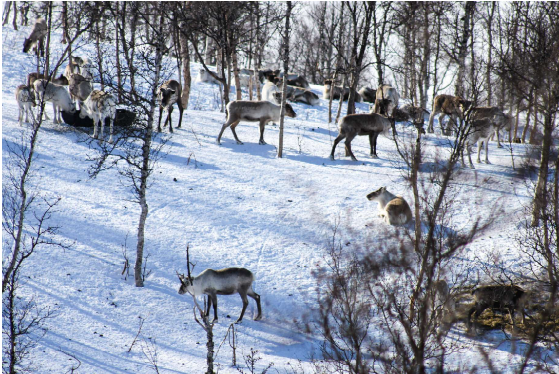
Boazodoallit geat leat hárrjánan biebmat leat muitalan ahte lea dehálaš biebmat dan máde viiddis guovllus ahte BUOT bohccot ožžot biepmu OKTANIS.

sat, go buohtastahtta suoidnespáppaiguin maidda ii leat mihkkege lasihuvvon. Nu movt suinniiguin, de lea dehálaš ahte rássi ii ge láddjejuvvo beare maŋŋit šad-danáigodagas vai boazu sáhtta suolbmudit fuođđara ja ávkki atnit rási biepmus.