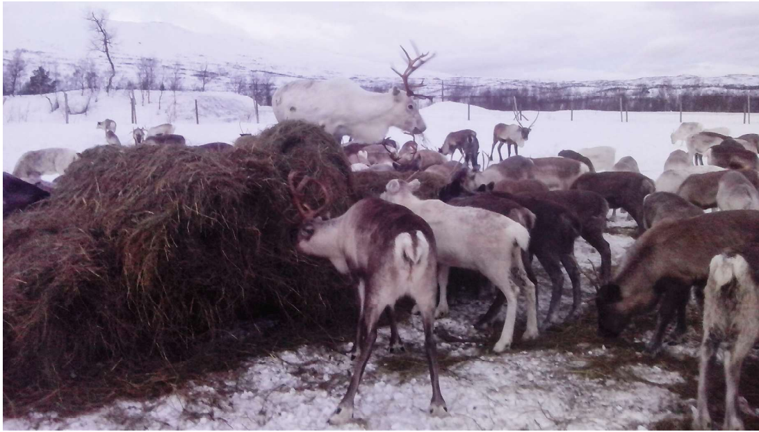
Bohccot mat borret roavvafuođđara suoidnespáppain. Bohccuid berre biebmagoahtit ovdal go nealgugohtet, sihkkarastin dihte ahte boazu atná ávkki odda fuođdaris. Čuovo dárkilit mielde mo guohtundilálašvuodat leat!!