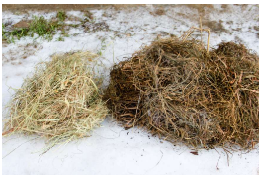
Suinniin gurut bealde govas lea buorre kvalitehta ja dohkkejit bures fuoðarin bohccui. Suoinnit olgeš bealde leat njuoskasat ja guhppon, ii ge daiguin ábut biebmam bohcco. Iešgudetlágan rásiit ja šattut gielttis váikkuhit suinniid máhkui.

Fápmofuoðar lea gordne- ja soija-pellets masa leat lasihuvvon minerálat heivehuvvon bohcco biebmodárbui. Dábálaččat láve veahás ádjánit ovdal go boazu hárbána fápmofuoðara máhkui ja borragoahá dan bures. Fápmofuoðaris lea unnán struktuvra, ja