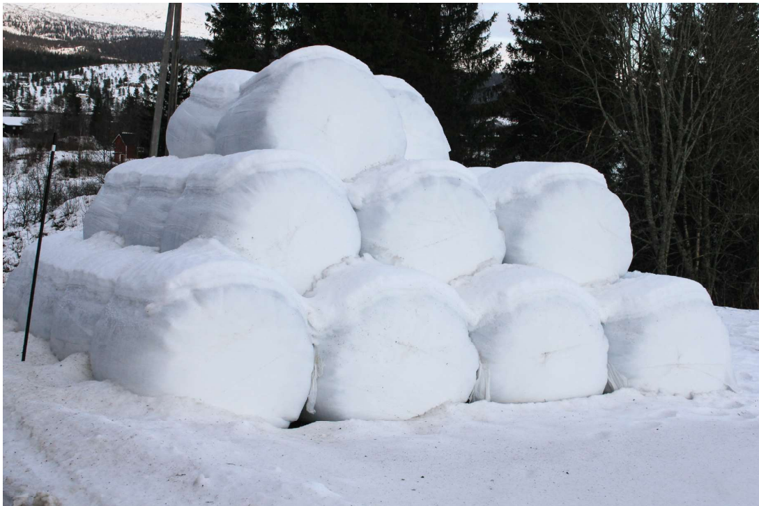
Suoidnespáppain ferte leat buorre kvalitehta vai boazu sáhtttá dain ávkki atnit liigebiebmun. Suoidnespáppat mat sisttisdollet unnit go 25 proseantta goikeávdnasa jikŋot garra spábban buolašin.

Buvttadeaddjit ávžžuhuvvojit garrasit atnit ensilerenávdnasiid suoidnespáppain sihkkarastin dihte ahte gevvat riekta ja váras váldin dihte energijja, earret eará sohkkara mii suddá čázis. Iskkadeamit čájejit ahte bohccot leat váibmileappot suoidnespáppaide madda leat lasihuvvon ensilerenávdna-