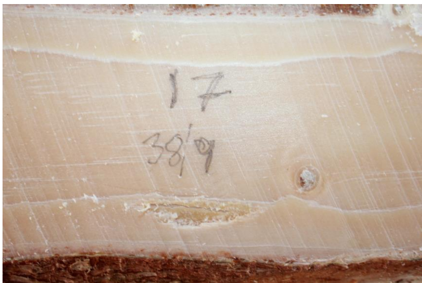
Eksempel på stor kvaelomme som er 38 mm bred og 9 mm høy.

Densitet, fiberhelling og stammeresonans for beregning av E-modul er målt på tre gjentak av hver klon i arkivet, mens vekst og skader er registrert på alle trær i arkivet. Egenskaper som overhøyde, diameter, dobbelstamme, dobbeltopp, toppbrekk, stammebrekk, gankvist, barksprekk, stammesprekk, kvaeutflod, barkskader og slengete vekst er undersøkt på alle stående trær. En stamme fra 26 utvalgte kloner er felt, rotstokkene er merket og ble transportert til sagbruk og splittet opp i minst to planker. På disse er det vurdert svartkvist, stammesprekk og tellet antall kvaelommer pr arealenhet.