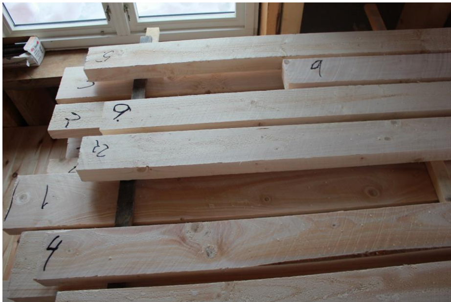
Plank som ligger til tørking på Sønnesyn sag i Luster.

Skogfrøverket planlegger våren 2018 å etablere fem feltforsøk med de toårige potteplantene som dette prosjektet har produsert. Forsøkene er tenkt undersøkt jevnlig i regi av Skogfrøverket og tallmaterialet skal legges inn i planteforedlingsbasen til NIBIO og Skogfrøverket.