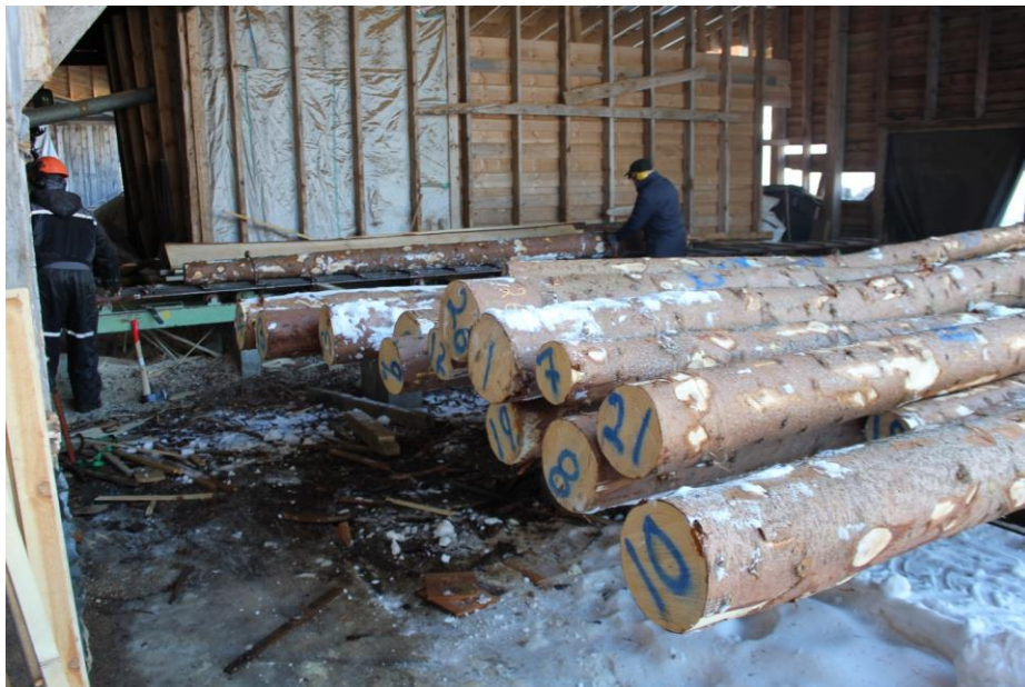
Utvalgte kloner i Årøy trearkiv i Sogn klare for saging på Sønnesyn sag i Luster.