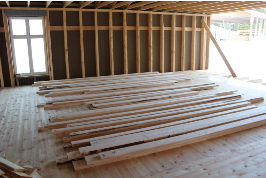
Vurdert trelast på Sønnesyn sag i Luster.